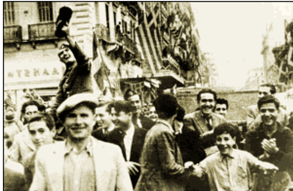
Από τους μεγάλους πανηγυρισμούς της Αθήνας, για τις νίκες του ελληνικού στρατού εις βάρος των Ιταλών εισβολέων – Большой праздник в Афинах. Люди отмечают победы греческой армии над итальянскими войсками

Είναι αξιοθαύμαστος ο τρόπος, με τον οποίο σύσσωμος ο ελληνικός λαός αντιδρά στην είδηση του πολέμου που ξεχύνεται στους δρόμους το πρωί της 28 ης Οκτωβρίου. Δεν διακρίνεται ούτε φόβος ούτε απόγνωση στα πρόσωπα του κόσμου, μονάχα αποφασιστικότητα και θάρρος.